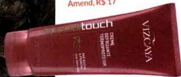
Creme Leave-in. Vizcaya, R$ 12,70

Zoey Deschanel fica muito linda com essa franja