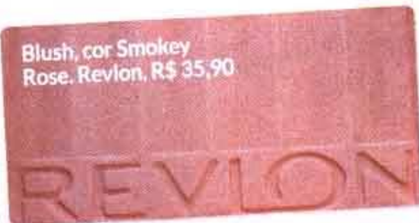
Blush, cor Smokey Rose, Revlon, R$ 35,90