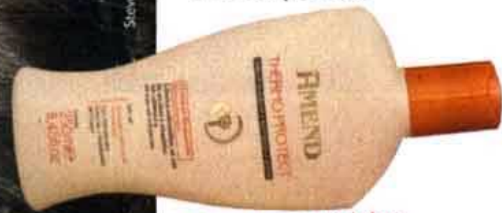
Xampu termoprotetor. Amend, R$ 17

♥ Para mantê-la no comprimento certo, você deve aparar as pontas uma vez por mês.