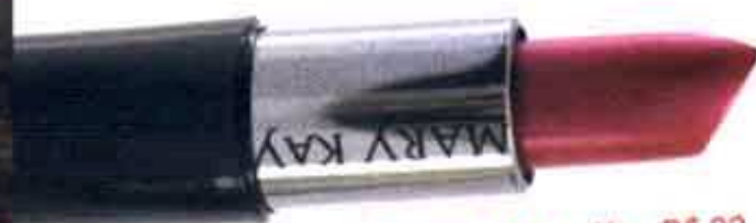
Batom cremoso, cor Hibiscus, Mary Kay, R$ 32