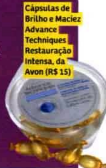
Cápsulas de Brilho e Maciez Advance Techniques Restauração Intensa, da Avon (R$ 15)

Este corte tem um franjão repicado para dentro do cabelo, começando na altura dos olhos. Invista nele se você tem a franja meio lisa ou até mais ondulada.