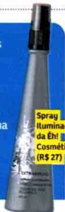
Spray Iluminador, da Éh! Cosméticos (R$ 27)

Este é para as mais clássicas. Os fios ficam um pouco abaixo do ombro num corte reto, que é repicado nas pontas com navalha para dar mais leveza. Um spray de brilho deixa o cabelo lindo.