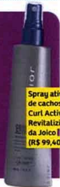
Spray ativador de cachos Curl Activator Revitalizing, da Joico (R$ 99,40)

Os fios ganham um repicado longo em todo o comprimento, feito principalmente na parte da frente (repare nas pontas de tamanhos diferentes). O resultado é volume sob controle.