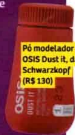
Pó modelador OSIS Dust it, da Schwarzkopf (R$ 130)

O cabelo foi todo desfiado da metade do rosto para as pontas. A franja à altura do nariz foi feita para usar de lado. Abuse dos finalizadores que dão textura aos fios, como um pó modelador.