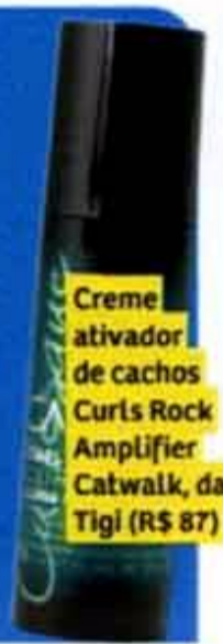
Creme ativador de cachos Curls Rock Amplifier Catwalk, da Tigi (R$ 87)

Sem medo: o corte médio também foi feito para o seu cabelo! Este aqui é um chanel repaginado, com fios retos desfiados nas pontas e mais longos na frente. Um ativador de cachos é seu aliado.