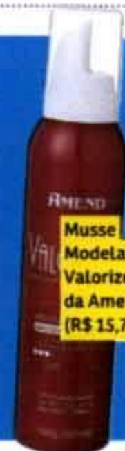
Musse Modeladora Valorize, da Amend (R$ 15,75)

As ondas naturais ficam suaves e em evidência com os fios bem longos e repicados apenas nas pontas. Para realçar o ondulado, aplique musse volumizadora e amasse o cabelo com as mãos.