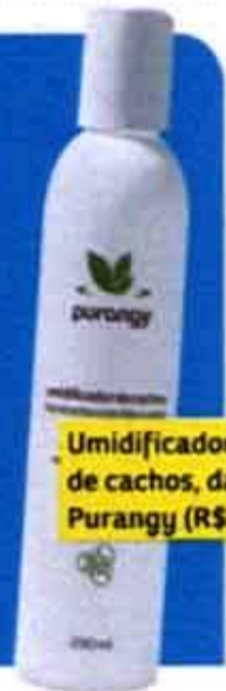
Umidificador de cachos, da Purangy (R$ 18)

Para manter o cabelão longo lindo e leve, aposte em um repicado do meio do comprimento para o fim. Este corte mantém o volume controlado e os cachos, definidos e com forma.