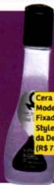
Cera Seca Modeladora e Fixadora Dry Style Purple, da De Sirius (R$ 72,45)

Os fios recebem um repicado suave da metade do comprimento para baixo. Na frente, o repicado apenas contornou o rosto. A franja longa deixa o look menos sério. Modele as pontas com cera.