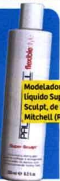
Modelador líquido Super Sculpt, de Paul Mitchell (R$ 50)

O cabelo é supercurto na nuca e mais longo no topo da cabeça, onde o volume fica concentrado. Pode ser feito com navalha para dar uma encorpada nos fios. Modele com finalizadores.