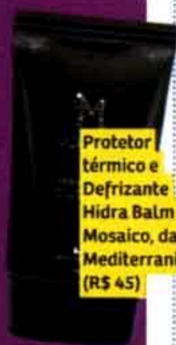
Protetor térmico e Defrizante Hydra Balm Mosaico, da Mediterrani (R$ 45)

O corte tem leves camadas e o desfiado das pontas fica mais curto logo abaixo do queixo. É perfeito para quem gosta de usar os fios bem lisos, naturais ou com escova.