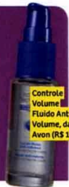
Controle Volume Fluido Anti-Volume, da Avon (R$ 16)

Sua franja deve ser discreta e longa (de preferência, ultrapassando um pouco os olhos, ok?). Corte apenas algumas mechas ao redor do rosto para dar leveza ao look.