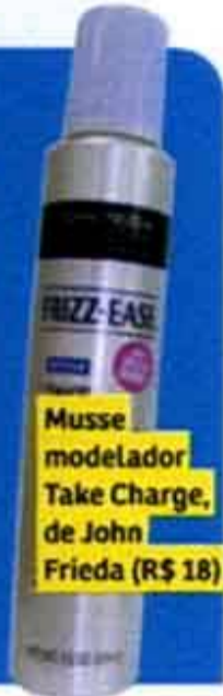
Musse modelador Take Charge, de John Frieda (R$ 18)

A franja ideal para o seu cabelo é na altura do queixo. Peça para o cabeleireiro navalhar os fios do meio para as pontas. Aposte na musse para modelar os cachos.