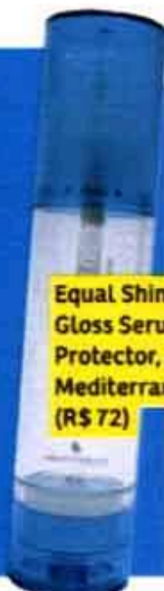
Equal Shine Gloss Serum Protector, da Mediterrani (R$ 72)

A franja começa no início da testa, é cheia e chega pertinho dos olhos. Ela é ideal para rostos pequenos. Para mantê-la em dia, passe um sérum de brilho e seque com uma escova média.