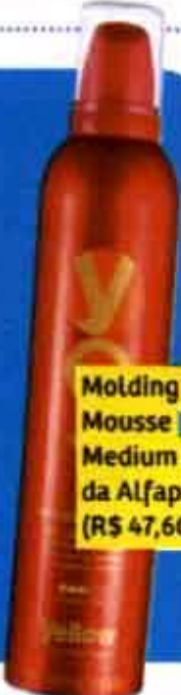
Molding Mousse Medium Hold, da Alfaparf (R$ 47,60)

Chanel para as que não têm medo de assumir o volume. Este é sem franja, totalmente reto. Valorize as ondas com difusor e musse. A divisão lateral dos fios deixa o look mais charmoso.