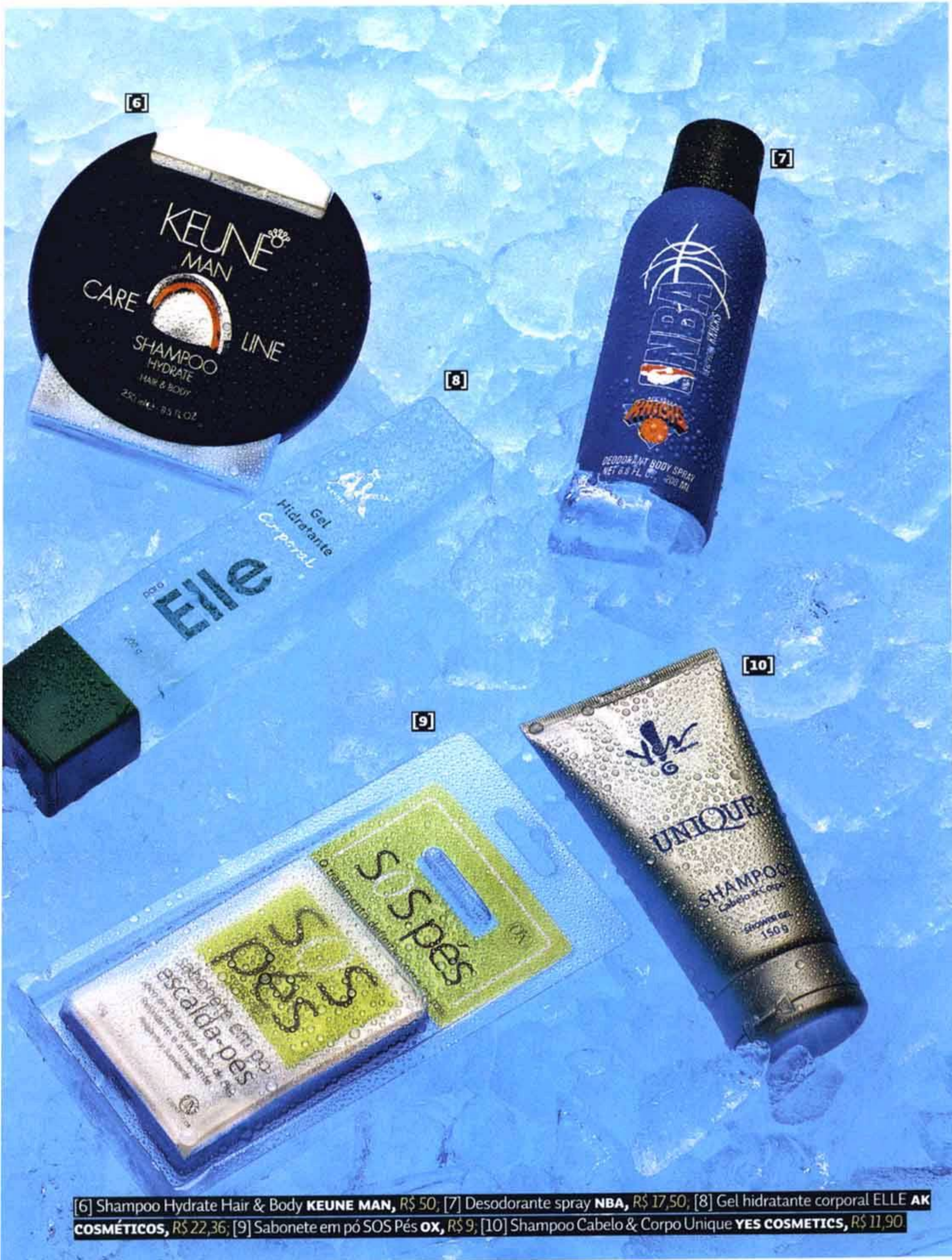
[6] Shampoo Hydrate Hair & Body KEUNE MAN , R$ 50; [7] Desodorante spray NBA , R$ 17,50; [8] Gel hidratante corporal ELLE AK COSMÉTICOS , R$ 22,36; [9] Sabonete em pó SOS Pés OX , R$ 9; [10] Shampoo Cabelo & Corpo Unique YES COSMETICS , R$ 11,90