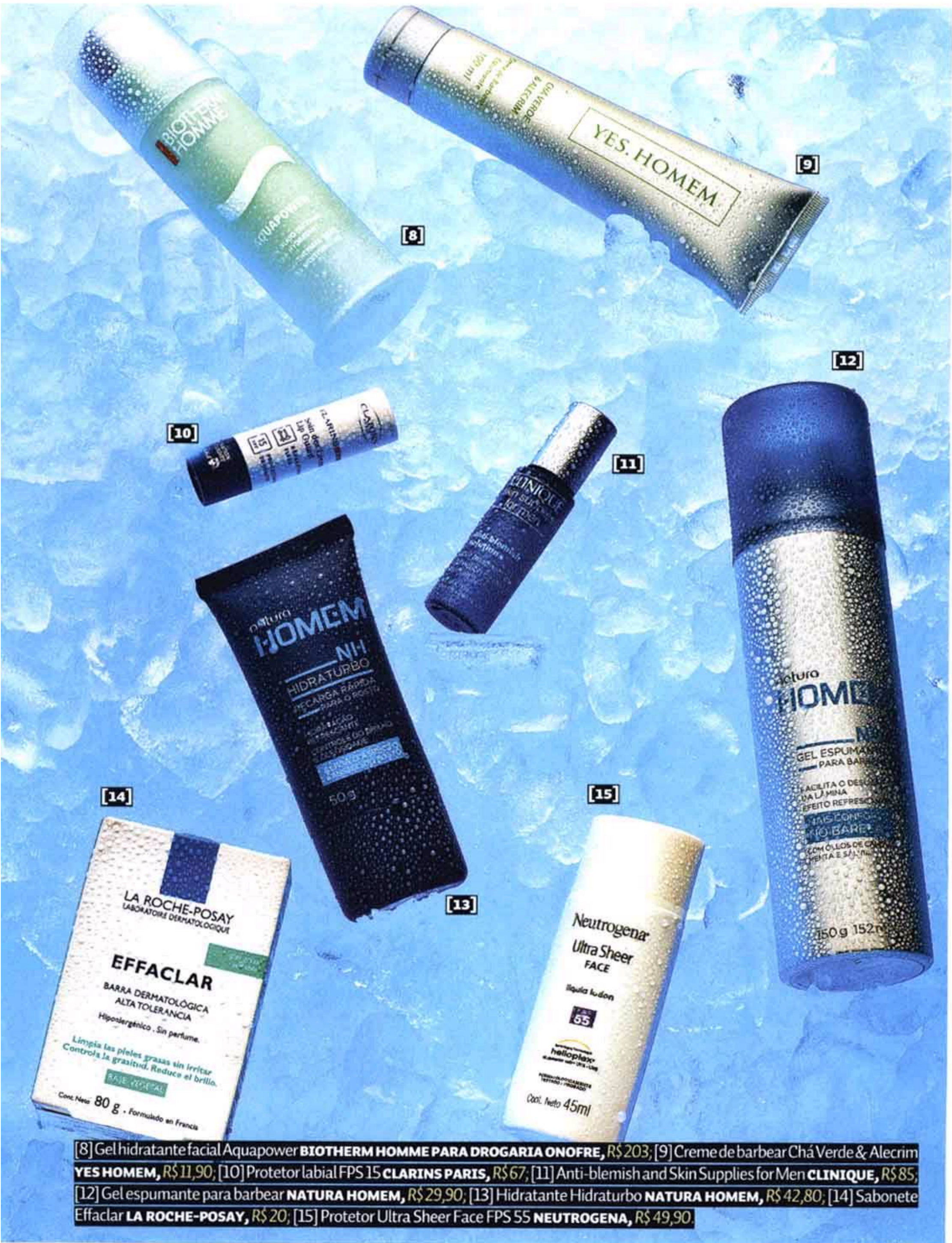
[8] Gel hidratante facial Aquapower BIOThERM HOMME PARA DROGARIA ONOFRE , R$ 203; [9] Creme de barbear Chá Verde & Alecrim YES.HOMEM , R$ 11,90; [10] Protetor labial FPS 15 CLARINS PARIS , R$ 67; [11] Anti-blemish and Skin Supplies for Men CLINIQUE , R$ 85; [12] Gel espumante para barbear NATURA HOMEM , R$ 29,90; [13] Hidratante Hidrat Turbo NATURA HOMEM , R$ 42,80; [14] Sabonete Effaclar LA ROCHE-POSAY , R$ 20; [15] Protetor Ultra Sheer Face FPS 55 NEUTROGENA , R$ 49,90